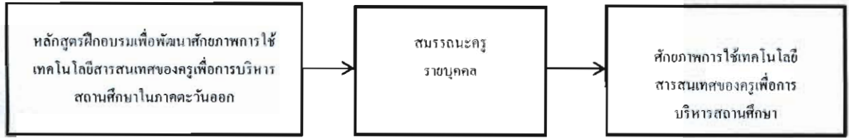
ภาพที่ 2 กรอบแนวคิดในการวิจัย