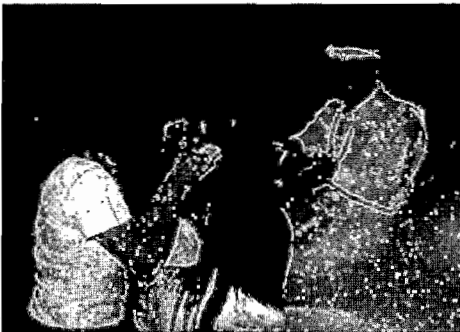
ภาพที่ ๕ ครูไพฑูรย์ เข้มแข็ง โดยนายสันติ อุดมศรี วันที่ ๒๔ ก.ค. ๒๕๕๓

3. ครูไพฑูรย์ เข้มแข็ง ผู้มาทำหน้าที่อ่านโองการพิธีไหว้ครูนาฏศิลป์ เกิดเมื่อวันที่ 12 กันยายน 2494 ที่ตำบลบางไทรอำเภอบางไทร จังหวัดพระนครศรีอยุธยา เป็นบุตรของนายใหญ่และนางเสวียง เข้มแข็ง มีพี่น้องร่วมบิดามารดา 9 คน โดยท่านเป็นบุตรคนที่ 5 สมรสกับนางสิริพร มีบุตรธิดา 2 คน ท่านได้รับมอบหมายให้เป็นครูอ่านโองการไหว้ครูนาฏศิลป์จากอาจารย์อุดม อังศุธรเมื่อวันที่ 8 มิถุนายน 2542