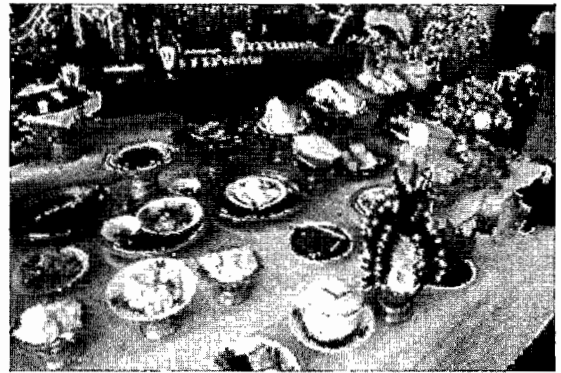
ภาพที่ 2-3 เครื่องบวงสรวงบูชาครู ซึ่งนิสิตชั้นปีต่างๆได้ร่วมกันจัดเตรียม โดยนายสันติ อุดมศรี วันที่ 24 ก.ค. 2553

จะเห็นได้ว่า การจัดกิจกรรมในลักษณะนี้ช่วยส่งเสริมให้นิสิตรู้จักการวางแผนและได้ทำงานร่วมกัน ทำให้นิสิตเกิดความกระตือรือร้นสนใจ ดังจะเห็นได้จากบรรยากาศในห้องประชุมขณะที่แบ่งหน้าที่ความรับผิดชอบจะเต็มไปด้วยความสนุกสนานจากการมีจิตอาสาของนิสิตแต่ละคน มีการหารือร่วมกันถึงแผนในการสรรหาเครื่องบูชาครูว่าจะนำมาจากสถานที่ใด ราคาเท่าไร บวกลบคูณหารค่าใช้จ่ายกันอย่างไร ใครจะเป็นคนซื้อ ใครจะเป็นคนหิ้ว ใครจะเป็นคนเก็บสตางค์ เป็นต้น และเมื่อถึงวันงานพิธี เครื่องสิ่งของที่กำหนดไว้ก็จะทยอยกันมาเพื่อจัดเรียงกันตั้งแต่เช้าตรู่อย่างครบถ้วนสมบูรณ์ เตรียมพร้อมสำหรับพิธีในช่วงสาย