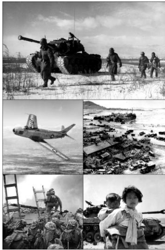
ภาพที่ 9: ความขัดแย้งภายในประเทศเกาหลี