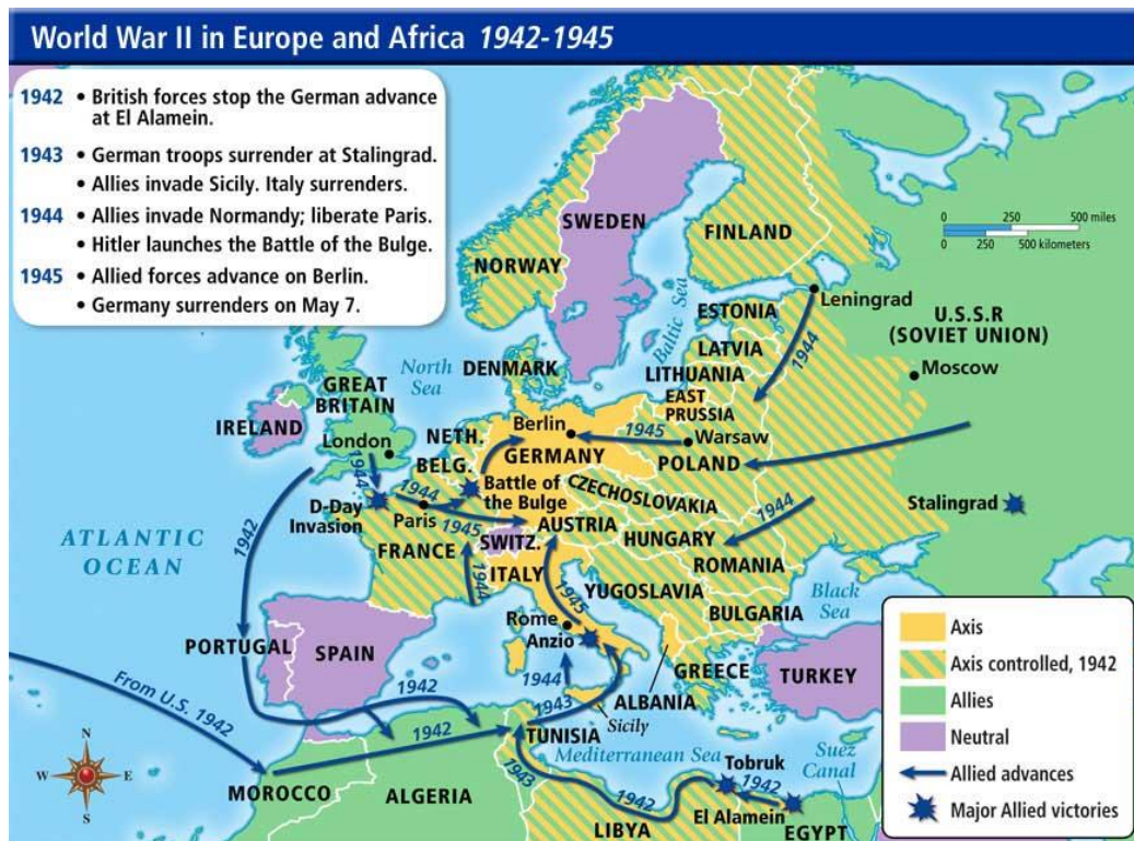
ภาพที่ 7: สงครามโลกครั้งที่ 2 ในยุโรปและแอฟริกา ในช่วงปี ค.ศ.1942-1945