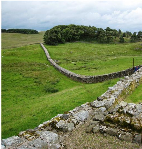
ภาพที่ 1: กำแพงฮาเดรียนุส (Hadrian's Wall)

มหายุทธศาสตร์ในสมัยจักรวรรดิโรมัน (Roman Empire) ในช่วง 625 ปีก่อนค.ศ.-ค.ศ.476 เป็นยุทธศาสตร์ทางการทหารที่จักรวรรดิโรมันใช้ในลักษณะที่ทำให้เกิดความมั่นคง โดยสร้างแนวป้องกันรอบอาณาเขต ตัวอย่าง เช่น กำแพงฮาเดรียนุส (Hadrian's Wall) ณ ดินแดนอังกฤษในปัจจุบัน (เริ่มก่อสร้างในสมัยของจักรพรรดิฮาเดรียนุส ในปี ค.ศ. 122) ดังภาพที่ 1