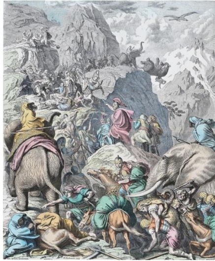
ภาพที่ 3: กองทัพช้างของฮันนิบาลข้ามเทือกเขาแอลป์ระหว่างสงครามพิวนิกครั้งที่ 2