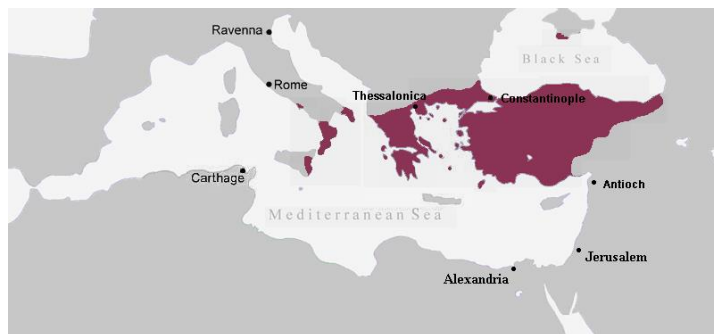
ภาพที่ 5: จักรวรรดิไบแซนไทน์ ในปี ค.ศ. 867

ก่อนถือกำเนิดจักรวรรดิออตโตมัน (Ottoman Empire : ค.ศ.1453-ค.ศ.1923) จักรวรรดิโรมันได้แบ่งการปกครองออกเป็นจักรวรรดิโรมันตะวันตก และจักรวรรดิโรมันตะวันออกหรือจักรวรรดิไบแซนไทน์ (Byzantine Empire) ซึ่งมีคอนสแตนติโนเปิลเป็นเมืองหลวง ดังภาพที่ 5 ต่อมาจักรวรรดิโรมันตะวันตกได้ล่มสลายไปในคริสต์ศตวรรษที่ 5 ส่วนจักรวรรดิไบแซนไทน์ ยังดำรงอยู่เรื่อยมากว่าพันปี (ค.ศ.330-ค.ศ.1453)