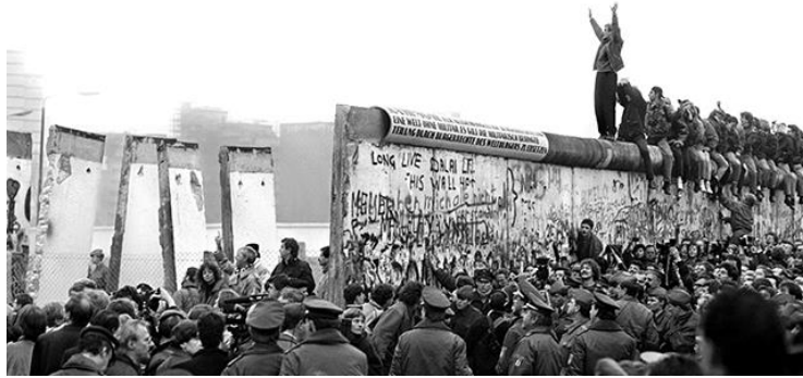
ภาพที่ 11: กำแพงเบอร์ลินถูกทำลาย