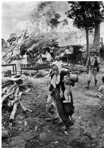
ภาพที่ 10: บ้านเรือนที่ถูกเผาในสงครามเวียดนาม

และสงครามเวียดนามในช่วง ค.ศ.1955-1975 ดังภาพที่ 10 ซึ่งเป็นสงครามตัวแทนของมหาอำนาจทั้งสอง คือ สหรัฐอเมริกา และสหภาพโซเวียต