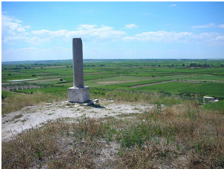
ภาพที่ 4: สภาพพื้นที่ของสมรภูมิแคนเนในปัจจุบัน

อย่างไรก็ตาม ฮันนิบาลก็รบชนะในหลายสมรภูมิต่อมาที่สำคัญ อาทิ สมรภูมิตเรเบีย (Battle of the Trebia) ใน 218 ปีก่อนคริสต์ศักราช สมรภูมิทะเลสาบแทรสิมีเน (Battle of Lake Trasimene) ใน 217 ปีก่อนคริสต์ศักราช และสมรภูมิแคนเน (Battle of Cannae) ทางตอนใต้ของกรุงโรม ใน 216 ปีก่อนคริสต์ศักราช ทำให้กองทัพคาร์เธจเข้าใกล้ที่จะโอบล้อมกรุงโรม