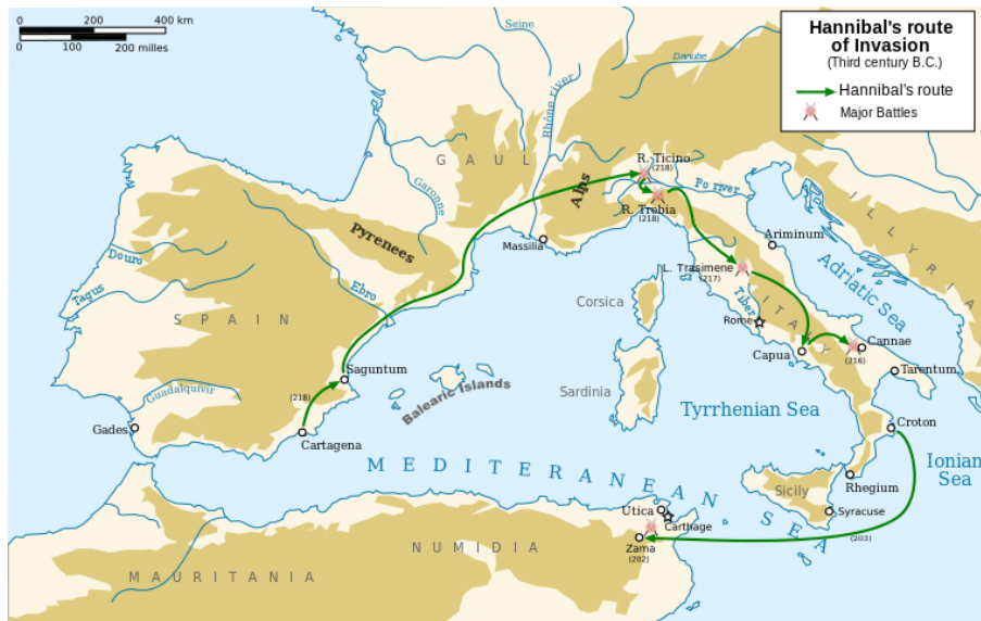
ภาพที่ 2: เส้นทางกรรบของ Hannibal