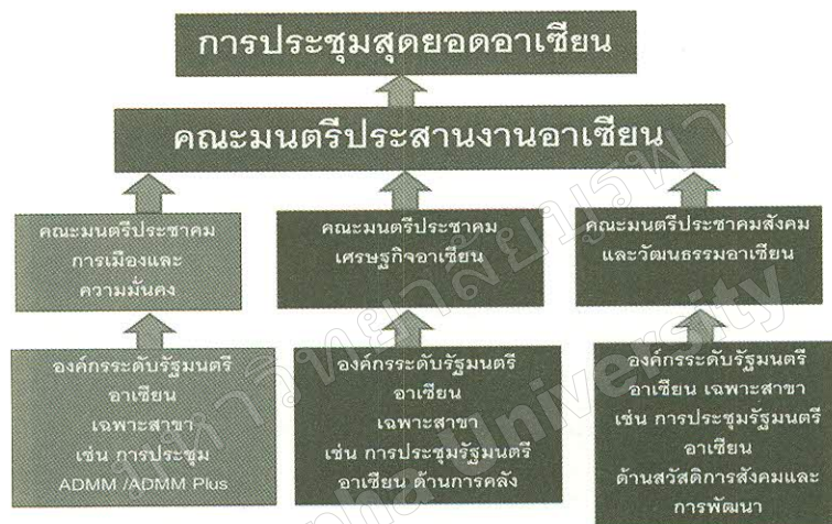
ภาพที่ 3 โครงสร้างอาเซียนภายใต้กฎบัตรอาเซียน

จะส่งผลดีต่อการประชุมสุดยอดอาเซียน (ASEAN Summit) ทั้งนี้ภายใต้กฎบัตรอาเซียน ผลการประชุมจากรัฐมนตรีกลาโหมอาเซียนจะเชื่อมโยงไปยังคณะมนตรีความมั่นคงอาเซียนและเข้าไปสู่คณะมนตรีประสานงานอาเซียน เพื่อนำเข้าสู่การประชุมสุดยอดผู้นำสุดยอดอาเซียนต่อไป