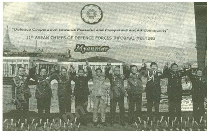
ภาพที่ 2 การประชุมผู้บัญชาการทหารสูงสุดอาเซียนอย่างไม่เป็นทางการ ครั้งที่ 10 ณ กรุงบันดาร์เสรีเบกาวัน ประเทศบรูไน เมื่อ 20 มี.ค. 56

ต่อมาในการประชุม ACDFIM ครั้งที่ 11 ณ กรุงเนปิดอว์ ประเทศเมียนมาร์ เมื่อ 4-8 มีนาคม พ.ศ. 2557 ผู้บัญชาการทหารสูงสุดอาเซียนได้กล่าวย้ำถึงความสำคัญในการสร้างความร่วมมือด้านการป้องกันประเทศระหว่างกัน โดยเน้นการแก้ไขปัญหาคความมั่นคงที่เกิดจากภัยคุกคามไม่ตามแบบด้านต่างๆ