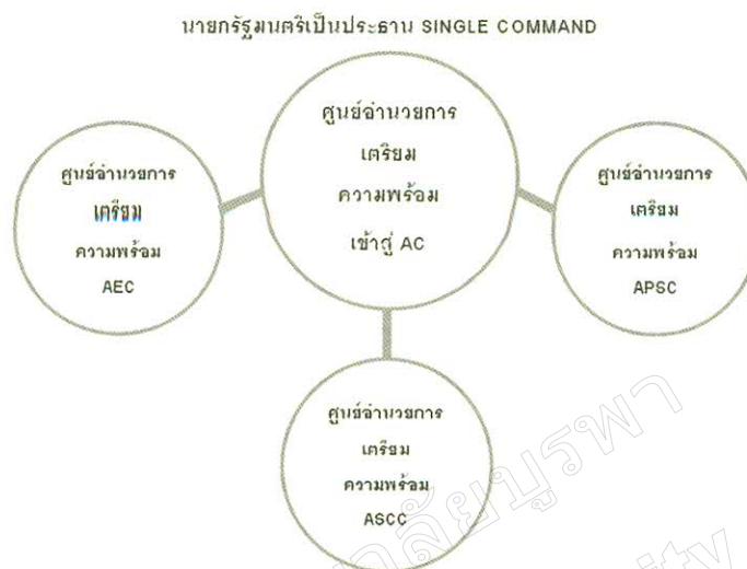
ภาพที่ 4 โครงสร้างการบริหารงานภาครัฐในการเตรียมความพร้อม ของประเทศไทยในการเข้าประชาคมอาเซียน

จากภาพเป็นการแสดงให้เห็นถึงการบูรณาการแผนงานต่างๆ ที่อยู่ใน 3 เสาหลักของการเตรียมความพร้อมเข้าสู่ประชาคมอาเซียน โดยมีศูนย์อำนวยการเตรียมความพร้อมในการเข้าสู่ประชาคมอาเซียนในระดับชาติเป็นองค์กรหลักในการกำหนดยุทธศาสตร์ในภาพรวม เพื่อกำหนดทิศทางที่ชัดเจนในการเตรียมความพร้อมเข้าสู่ประชาคมอาเซียนของประเทศไทย ซึ่งยุทธศาสตร์ในภาพรวมเปรียบเสมือนพิมพ์เขียวของประเทศที่จะกำหนดเป้าหมายหรือทิศทางของนโยบายร่วมกัน ในส่วนนี้ นายกรัฐมนตรีสามารถที่จะเป็นประธานของศูนย์อำนวยการเตรียมความพร้อมในการเข้าสู่ประชาคมอาเซียนในระดับชาติเพื่อให้เกิดเอกภาพ ส่วนรายละเอียดของผู้ที่เกี่ยวข้องในการจัดทำยุทธศาสตร์ สามารถให้สำนักงานสภาพัฒนาการเศรษฐกิจและสังคมแห่งชาติ สำนักงานคณะกรรมการพัฒนาเศรษฐกิจและสังคมแห่งชาติ และสำนักงานข่าวกรองแห่งชาติเป็นคณะทำงานเพื่อร่วมกันกำหนดยุทธศาสตร์ในภาพรวม โดยยุทธศาสตร์ดังกล่าวจะเป็นนโยบายสาธารณะในการเตรียมความพร้อมเพื่อเข้าสู่ประชาคมอาเซียนของไทย ในราย