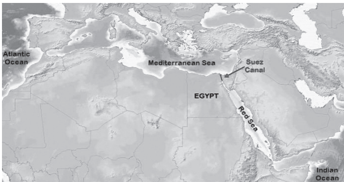
คลองสุเอซซึ่งมีบทบาทสำคัญในการคุมจุดยุทธศาสตร์ทางทะเลของอังกฤษ

เหตุการณ์ครั้งสำคัญเกิดขึ้นเมื่ออียิปต์ซึ่งเป็นจุดยุทธศาสตร์สำคัญที่ตั้งอยู่ทางทิศเหนือของทวีปแอฟริกา อีกทั้งยังตั้งอยู่บนจุดยุทธศาสตร์ระหว่างทะเลเมดิเตอร์เรเนียนกับทะเลแดง ซึ่งเป็นเส้นทางสำคัญในการลำเลียงสินค้าและการติดต่อทางคมนาคม นับจากอดีตสถานะของอียิปต์จึงทำให้อังกฤษให้ความสำคัญอย่างมากในฐานะที่เป็นพื้นที่ความมั่นคงทางการเมืองและความมั่งคั่งทางเศรษฐกิจของเส้นทางทะเลของทั้งสองทวีปเอเชียและทวีปยุโรป รัฐบาลอังกฤษต้องการสร้างมูลค่าการค้า รวมทั้งยังพยายามกีดกันชาติอื่น ๆ ไม่ให้เข้ามาสร้างอำนาจในอียิปต์ เนื่องจากอังกฤษหวังที่จะใช้อียิปต์เป็นฐานไปยังอินเดีย จีน รวมทั้งตลาดสินค้าในเอเชีย เช่น คาบสมุทรมลายู หมู่เกาะอินเดียตะวันออก และเชื่อมต่อไปยังอาณานิคมในออสเตรเลีย