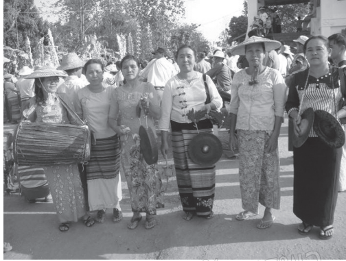
ภาพที่ 7 คณะกลองมอชิงบ้านต้นเห็ก เมืองจ๊กแม๋ บันทึกภาพวันที่ 6 มีนาคม 2558

การตีกลองมอชิงไม่มีการเรียกเสียงเป็นภาษากลอง การบันทึกทำนอง กลอง ฉาบ และมอชิง ในที่นี้บันทึกตามเสียงที่ปรากฏ โดยกำหนดให้การตีกลองหน้าใหญ่ ตีเปิดมือเป็นเสียงเป็ง การตีกลองหน้าเล็กตีกตมือกำหนดให้เป็นเสียงตูป เสียงฉาบใหญ่ กำหนดให้เป็นเสียงแช่ และเสียงมอชิงกำหนดให้เป็นมง ตัวอย่างการถอดทำนอง ในวงกลองมอชิง