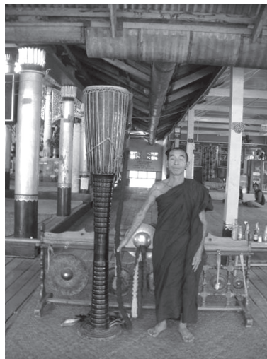
ภาพที่ 3 เจ้าอาวาสวัดปี่หย่องคองกับกลองกันยาวในวัด

การประสมวงกลองกันยาว ปรากฏรูปแบบเดียวกันทั้งสิ้น กล่าวคือประกอบด้วย กลองกันยาว 1 ใบ มอญ 1 ชุด (มอญ เป็นภาษาไทยใหญ่ หมายถึง โหม่ง) โดยมอญจะปรากฏ ชุดละ 5 ใบ และ 6 ใบ เป็นส่วนใหญ่ และฉาบใหญ่ซึ่งมีขนาดเส้นผ่านศูนย์กลาง 12 นิ้ว เป็นส่วนใหญ่ มีปรากฏขนาด 11 นิ้ว เป็นลำดับรอง ขนาดของมอญและการแขวนมอญ ปรากฏหลากหลายรูปแบบ รูปแบบแรก เป็นการแขวนมอญบนราวเดี่ยวแนวยาว มีการแขวนมอญเรียงกันจากเล็กไปหาใหญ่ โดยปรากฏลักษณะนี้เป็นส่วนใหญ่ รูปแบบที่สอง เป็นการแขวนเรียงกันแบบรูปแบบแรกแต่สลับขนาดเล็กใหญ่ของมอญ รูปแบบที่สาม เป็นการทำราวแขวนแบบสี่เหลี่ยมแล้วแขวนมอญเป็น 2 แถว และรูปแบบสุดท้าย เป็นการแขวนมอญบนราวเดี่ยวแนวยาว แต่แขวนลูกมอญซ้อนด้านล่างด้านบนเป็น 2 แถว ในราวเดียวกัน การตีมอญตีในวงกลองกันยาวปรากฏ 2 รูปแบบ รูปแบบแรก เป็นการแขวนมอญบนราวแล้วตีคนเดียว รูปแบบที่สอง เป็นการตีมอญแยกกันตีคนละ 1 ใบ โดยปรากฏรูปแบบแรกเป็นส่วนใหญ่ เสียงของมอญปรากฏเสียงเป็นคู่ 5 ได้แก่ เสียงซอลกับเสียงเร และเสียงโดกับเสียงซอลเป็นส่วนใหญ่ นอกจากนี้มีปรากฏ เสียงมอญที่ห่างกันเป็นคู่ 4 และคู่ 3 ด้วย คุณภาพเสียงมอญของคนกลองกันยาว ในเมืองจ๊อกแมปรากฏว่ามีคุณภาพเสียงตรงดีมาก