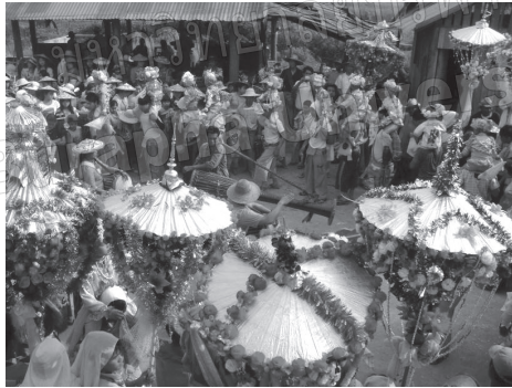
ภาพที่ 1 การแห่สาংลอง ณ วัดคายน่มอน เมืองจ๊อกแม่วงกลองกันยาวที่อยู่กลางวงสาংลอง

กลองกันยาวเป็นกลองขึ้นหน้าเดียว คล้ายกลองยาวของไทย แต่หุ่นกลองยาวมากกว่า หุ่นกลองกันยาวส่วนใหญ่ทำจากไม้ซ้อ ขึ้นหน้าด้วยหนังวัว ใช้ตีในงานบุญต่าง ๆ รวมถึงการตีประกอบการแสดงฟ้อนนก ฟ้อนโต ฟ้อนดาบ สำหรับเมืองจ๊อกแม่อีกว่างานปอยสาংลองเป็นงานบุญที่ใหญ่ที่สุด ซึ่งแตกต่างไปจากจังหวัดอื่นในรัฐชาน เช่น เมืองสีปอ งานบุญพระธาตุหรืองานปอยเดือน 4 เป็นงานบุญประจำปีที่ใหญ่ที่สุด