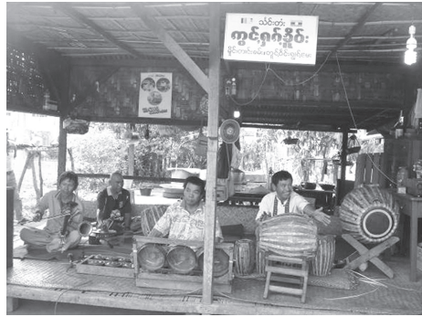
ภาพที่ 11 ตอยยอฮอร์นในวงจ้าดไต สาธิตโดยนักดนตรีคณะอังกะเคอ

การตีตอยยอฮอร์นประกอบการร้องกวมจี 1 กวมจี 2 สามารถสรุปผลการวิจัยได้ดังนี้