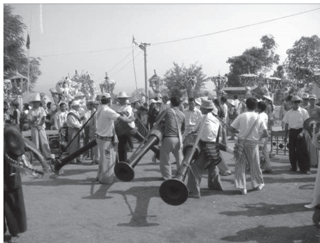
ภาพที่ 2 กลองกันยาวจำนวนมากในขบวนแห่สาংลอง