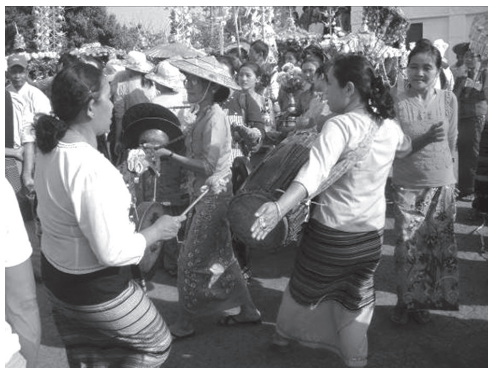
ภาพที่ 8 การตีกลองมองเซิงในขบวนแห่ศาลง วัดคายนม่อน เมืองจ๊อกแม วันที่ภาพวันที่ 6 มีนาคม 2558