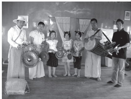
ภาพที่ 6 วงกลองกันยาวบ้านนาขอ เมืองจ๊อกแม บันทึกภาพ 13 มีนาคม 2558