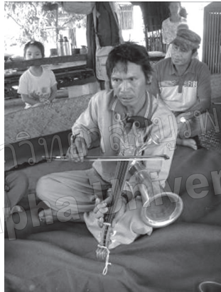
ภาพที่ 9 คุณครูสาปอ นักสีตอยอฮอร์นคณะอ่องฮักเคอ

ตนเองมาเป็นนักดนตรีตอยอฮอร์น โดยมาอยู่กับคณะคุณครูปะห่านที่เมืองจ๊อกแม คุณครูสร้างสวยอธิบายว่า “ทำนองตอยอที่ยากที่สุดคือ ทำนองจี 1 ร้องความจะยากที่สุด เพราะไม่รู้ว่านักร้องจะพูดอะไรออกมา จะต้องติดตามไปให้ได้ แต่ความที่ชอบมากที่สุดคือ ความจี 2” (สร้างสวย, สัมภาษณ์ 7 มีนาคม 2558)