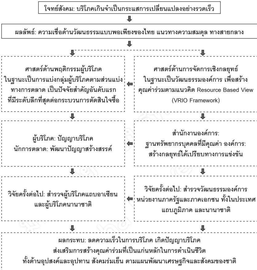
ภาพที่ 3 ภาพรวมทิศทางการวิจัยเพื่อตอบโจทย์การบริโภคเกินจำเป็น