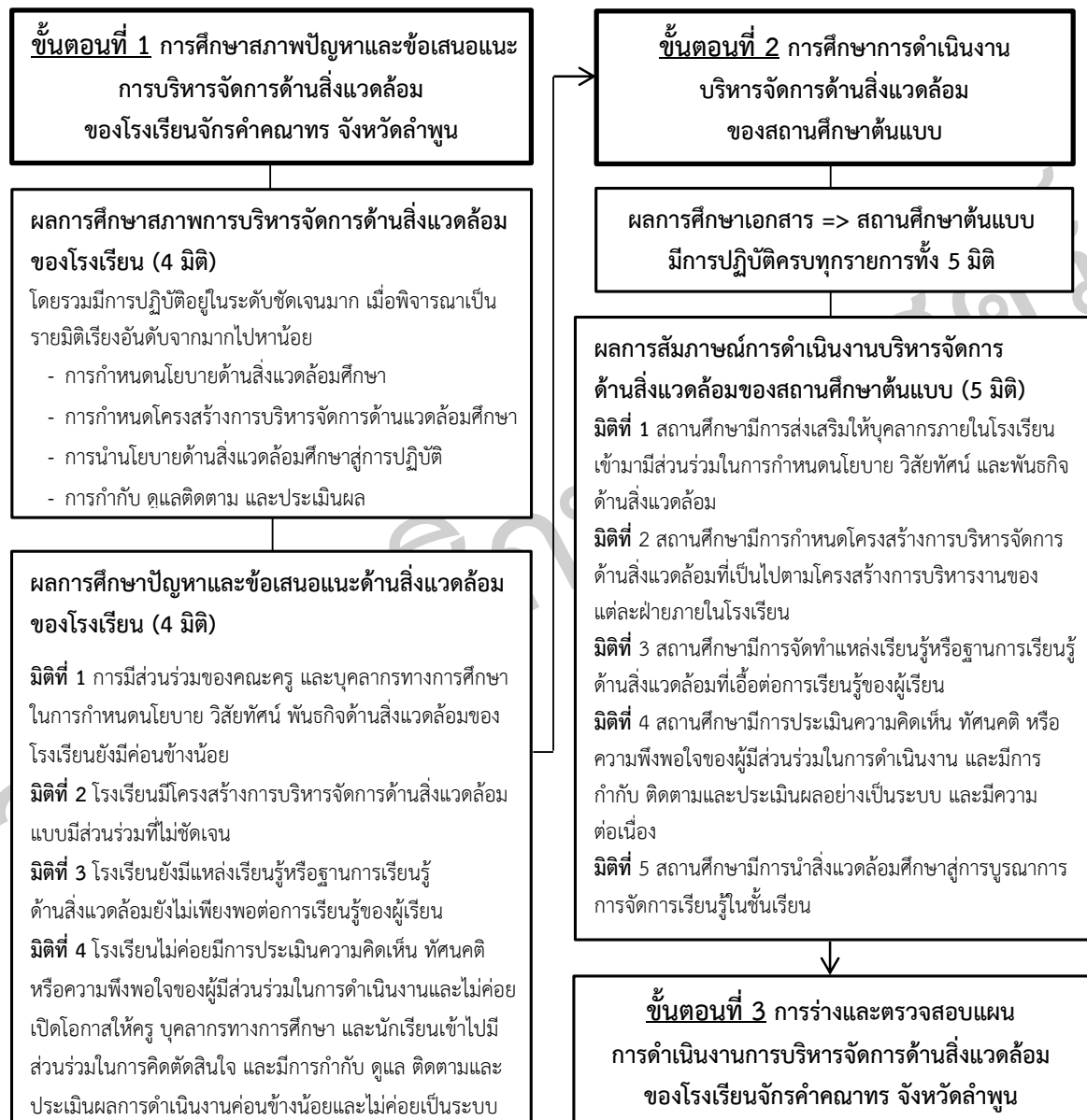
ภาพที่ 2 สรุปผลการการศึกษาสภาพ ปัญหา และข้อเสนอแนะการบริหารจัดการด้านสิ่งแวดล้อม และผลการศึกษาการดำเนินงานบริหารจัดการด้านสิ่งแวดล้อมของสถานศึกษาต้นแบบ

ผลการศึกษากำหนดแผนการดำเนินงานการบริหารจัดการด้านสิ่งแวดล้อมของโรงเรียน จักรคำคณาทร จังหวัดลำพูน สามารถสรุปได้ดังนี้