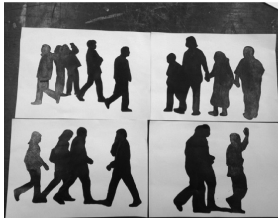
ภาพที่ 1 : ภาพร่างผลงานลายเส้นก่อนขยายทำผลงานจริง