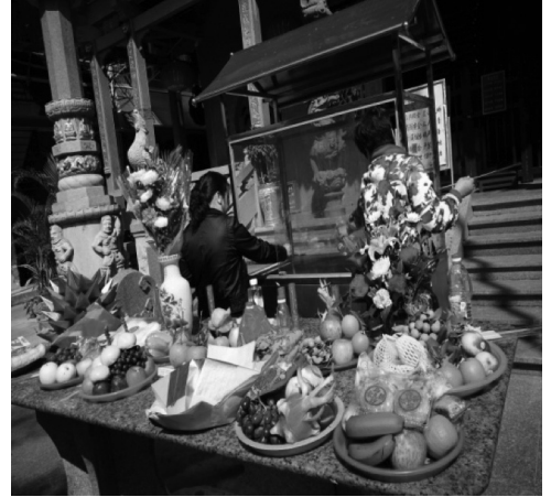
ภาพที่ 4 รูปการจัดเตรียมของสำหรับเซ่นไหว้ของชาวแต้จิ๋วในจีน

ชาวแต้จิ๋วจีนและชาวแต้จิ๋วไทยนิยมใช้เทียน รูป หมู ไก่ เป็ด แกะ กระดาษเงินทอง เหล้า ขนม และผลไม้เป็นของเซ่นไหว้ เทศกาลเซ็งเม็งประจำ ซึ่งมีความหมายในเชิงสิริมงคล ซึ่งเป็นประเพณีที่เปี่ยมด้วยทรงคุณค่าความหมายและมีบทบาทในการดำรงคุณธรรม ความดีงาม ยังความสงบสุขแต่สังคัม โดยการจัดเตรียมของสำหรับเซ่นไหว้ในเมืองไทยไม่มีชาและปู ซึ่งเมืองจีนจะมีของเซ่นไหว้แบบนี้