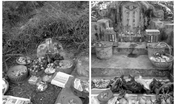
ภาพที่ 8 รูปการประกอบพิธีกรรมเทศกาลเซ็งเม้งในจีน

การประกอบพิธีกรรมนี้ เป็นพิธีกรรมที่แสดงถึงความกตัญญูตเวทีที่มีต่อบรรพบุรุษ แสดงถึงการมีความเอื้อเฟื้อเผื่อแผ่และสะท้อนให้เห็นถึงความรักใคร่สามัคคีกัน นอกจากนี้ยังทำให้เหล่าเครือญาติได้มาร่วมพิธีกรรมนี้ได้พบปะสังสรรค์ กินเลี้ยงกันหลังจากเสร็จพิธี เป็นการสร้างสายสัมพันธ์ภายในครอบครัวและเหล่าเครือญาติ