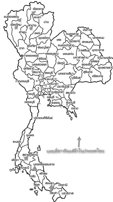
ภาพที่ 2 แผนที่ชาวแต้จิ๋วในประเทศไทย ที่มา: ออนไลน์. (ผู้วิจัยปรับปรุงข้อมูลแผนที่)

ที่มีอยู่มิให้สูญหาย และประชาสัมพันธ์เผยแพร่ กระจายข่าวให้บุคคลอื่นได้รับรู้รับทราบถึงความเป็นเอกลักษณ์ของชาติ ตลอดถึงการทำนุบำรุง บูรณะซ่อมแซมให้อยู่ได้ยาวนาน