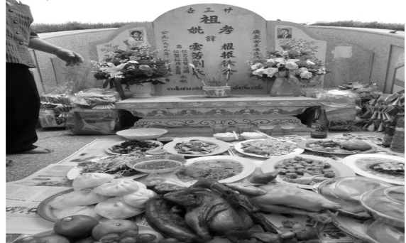
ภาพที่ 7 รูปการประกอบพิธีกรรมเทศกาลเซ็งเม้งในไทย