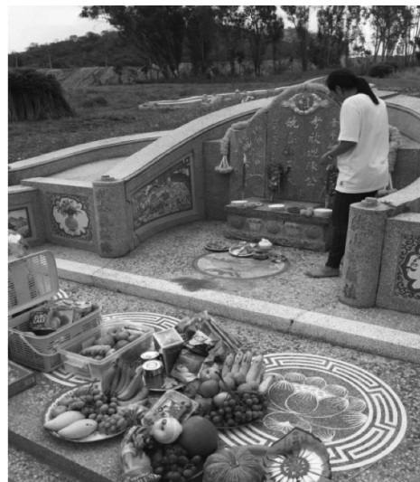
ภาพที่ 3 รูปการจัดเตรียมของสำหรับเซ่นไหว้ของชาวแต้จิ๋วในไทย