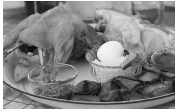
ภาพที่ 5 รูปอาหารที่ใช้ในการประกอบพิธีของเซ่นไหว้ในไทย