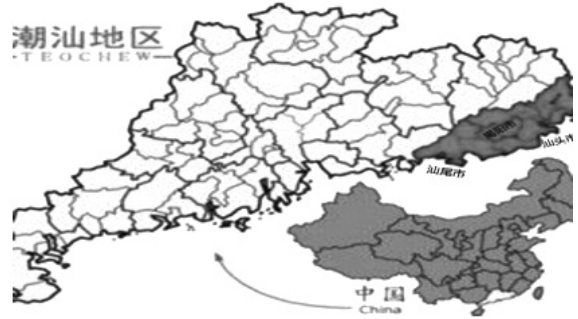
ภาพที่ 1 แผนที่ชาวจีนแต้จิ๋วในมณฑลกว่างตุ้งประเทศจีน (ผู้วิจัยปรับปรุงข้อมูลแผนที่)

การรักษาคุณค่าวัฒนธรรมที่ดีจำเป็นต้องมีกระบวนการเรียนรู้เนื้อหาและกิจกรรมการเรียนรู้ที่เหมาะสมซึ่งจะเป็นเครื่องมือสำคัญในอันที่จะทำให้ผู้เรียนได้เข้าใจในคุณค่าที่แท้จริง เนื่องจากปัญหาที่มนุษย์สร้างขึ้นมามีหลายประการ นับเป็นสิ่งที่สำคัญที่ส่งผลกระทบต่อสังคมและวัฒนธรรมซึ่งมักจะไปด้วยกันเสมอ และสิ่งเหล่านี้ก็มีความสัมพันธ์กับโครงสร้างทางสังคมด้วย คือการปกป้องรักษา ดูแลเอาใจใส่ สืบสานวัฒนธรรม