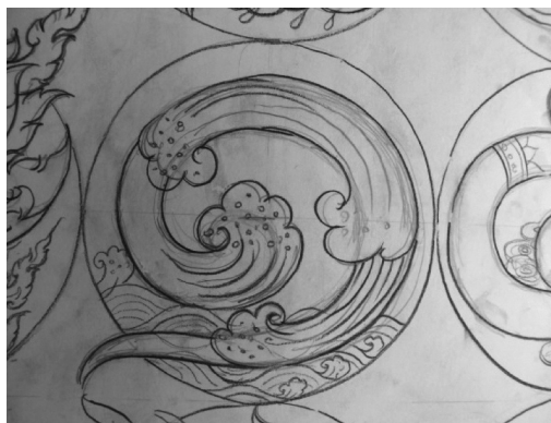
ภาพที่ 1 .การบริหารจัดการน้ำ

1. การบริหารจัดการน้ำ เนื่องจากน้ำเป็นปัจจัยแรกที่สำคัญต่อการทำการเกษตรจึงได้นำตัวอักษรเลข ๑ ไทย มาออกแบบเพื่อใส่ความหมายที่เกี่ยวกับการบริหารจัดการน้ำ ซึ่งได้นำรูปแบบของกังหันน้ำชัยพัฒนาออกมาออกแบบให้สัมพันธ์กับอักษรตัวเลข ๑