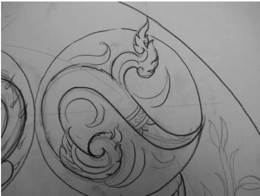
ภาพที่ 2. การปรับปรุงคุณภาพดิน

2. การปรับปรุงคุณภาพดิน คุณภาพของดินเป็นปัจจัยที่ต่อมากจากการบริหารจัดการน้ำ ผู้วิจัยได้นำเอาเนื้อหาจากโครงการแก่งดินในจังหวัดนราธิวาส การแก่ง คือ การทำให้ดินเปรี้ยวจัดแล้วตากดินที่เปรี้ยวจัดที่มีความเป็นกรดสูงให้แห้ง จากนั้น เติมน้ำปูนขาวที่มีความเป็นด่างลงไปบนดินแล้วให้น้ำให้ท่วมดินปล่อยให้แห้งอีกเติมน้ำอีกทำซ้ำจนดินเกิดความเป็นกลาง โดยได้นำเอาเนื้อหามาใส่ลงในอักษรตัวเลข ๒ ที่ออกแบบตัวเลข ๒ เป็นรูปหัวใจที่มีส่วนหัวแยกเป็นสองทางเปรียบกับความเป็นกรดเป็นด่างเมื่อทำให้เกิดความเป็นกลางนำสู่ดินก็จะใช้ทำการเพาะปลูกได้