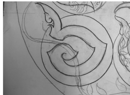
ภาพที่ 9. การทำปุ๋ยคูลูกแบบฟุ้งพา

8. การทำนาขั้นบันได การทำนาขั้นบันไดเป็นแนวคิดของในหลวงรัชกาลที่ 9 เพื่อแก้ปัญหาการเกษตรที่ อยู่บนพื้นที่สูงบริเวณเนินเขาซึ่งเป็นพื้นที่ทำการเกษตรยากเนื่องจากกักเก็บน้ำไม่ได้ พระองค์จึงคิดค้นวิธีแก้ปัญหาเหล่านี้ ผู้วิจัยได้หยิบยกหลักการนี้มาบรรจุในชั้นตอนที่ 8