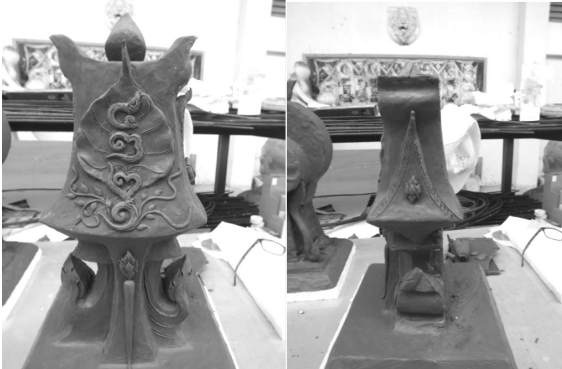
ภาพ 17-18 งานชิ้นที่ 4