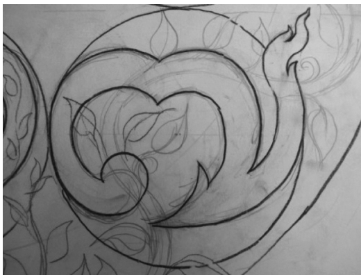
ภาพที่ 7. การทำไร่นาสวนผสม

6. การมีพระราชดำรัส ให้ช่วยเหลือในการนำขายผลผลิตของเกษตรกร เพื่อให้เกษตรกรมีอำนาจต่อรองกับพ่อค้า โดยการพระราชทานคำแนะนำในเจ้าหน้าที่ของรัฐจัดตั้งสหกรณ์การเกษตรขึ้น ดังนั้นผู้วิจัยจึงได้ทำการออกแบบตัวอักษรเลข ๖ ให้เหมือนกับลักษณะของรวมศูนย์กลาง นี่คือ 6 ชั้นตอนหลักในการทำเกษตรตามหลักของทฤษฎีปรัชญาเศรษฐกิจพอเพียง