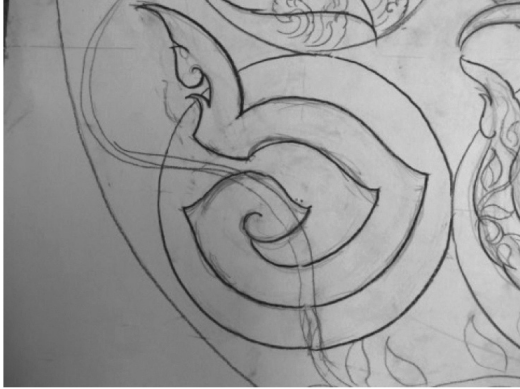
ภาพที่ 6. การจัดตั้งสหกรณ์การเกษตร

ได้ออกแบบตัวอักษรเลข ๕ ให้มีลักษณะคล้ายการกำลังหยอด กระปุกอมสิน