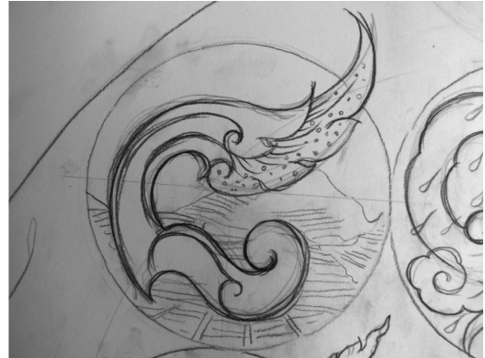
ภาพที่ 8. การทำนาขั้นบันได

ในการไถนาส่วนกลางตัวเลข ๗ ที่เป็นสองหยักก็เปรียบเสมือนดินที่ถูกคราดไถมีลักษณะมันวาวขึ้นข้างบนเสมอ