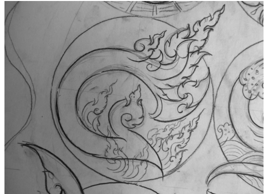
ภาพที่ 4. การทำปุ๋ยหมักชีวภาพ

8 เดือน ดังนั้นในหลวงทรงเห็นถึงปัญหาและอุปสรรคนี้ ท่านมีพระราชดำรัส ในการที่จะช่วยเหลือปัญหาภัยแล้งนี้ด้วยการหาแนวทางและวิธีการสร้างให้เกิดฝนนอกฤดูกาลขึ้นโดยการทำ 3 ขั้นตอน คือ เลี้ยงให้อ้วน ก่อทวน จูโจม ดังนั้นผู้วิจัยจึงได้หยิบยกขั้นตอนและกระบวนการนี้มาใส่ลงในอักษรตัวเลข ๓ ด้วยการออกแบบตัวเลข ๓ เป็นลักษณะเหมือนก้อนเมฆ