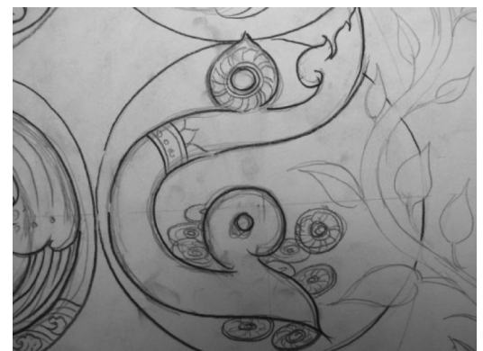
ภาพที่ 5. การทำบัญชีครัวเรือน

4. การทำปุ๋ยหมักชีวภาพ ผู้วิจัยได้นำเอาผลของการทำปุ๋ยหมักชีวภาพซึ่งนอกจากจะใช้เป็นธาตุอาหารของ พืช แล้วผลที่ได้ต่อมาก็คือพลังงานในรูปของก๊าซชีวภาพ โดยออกแบบตัวอักษรเลข ๔ ให้มีลักษณะของเปลวเพลิง