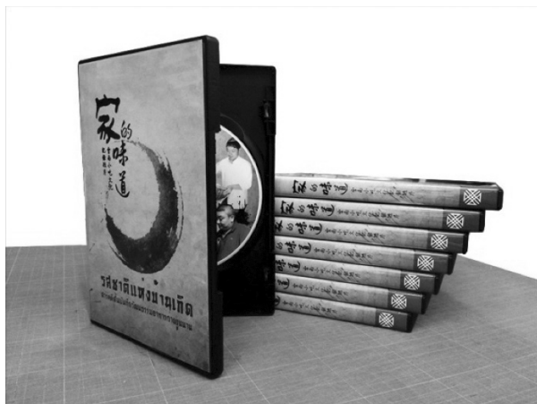
ภาพที่ 13 ซีดีสารคดีสั้นเรื่อง “รสชาติแห่งบ้านเกิด”