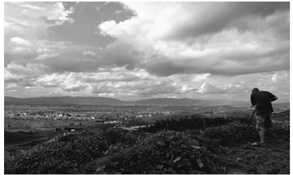
ภาพที่ 4 บันทึกการทำงานสร้างสรรค์สารคดีสั้นในอำเภอเจี้ยนส่วย (Lin Hongjun, 2016)