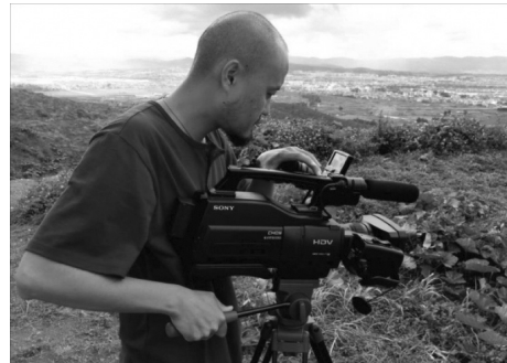
ภาพที่ 3 การถ่ายทำสารคดีสั้นโดยใช้ขีดยึดกล้อง DJI รุ่น Osmo และกล้องวิดีโอ Sony รุ่น HVR-HD1000C (Lin Hongjun, 2016)