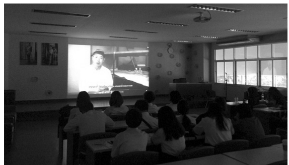
ภาพที่ 9 บรรยากาศขณะฉายสารคดี (Lin Hongjun, 2016)