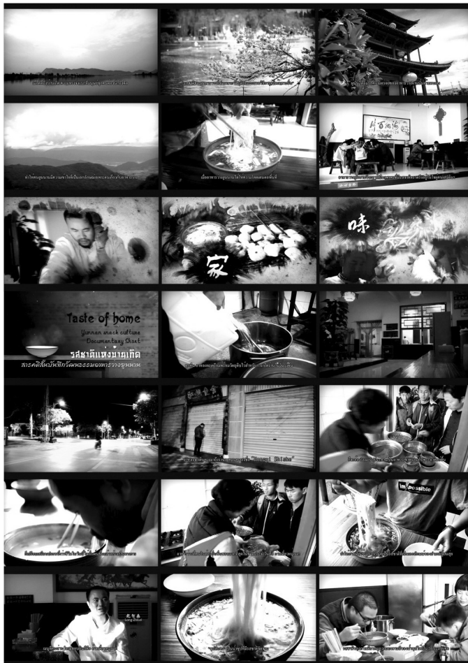
ภาพที่ 11 ผลงานสารคดีสั้นเรื่อง “รสชาติแห่งบ้านเกิด” 1