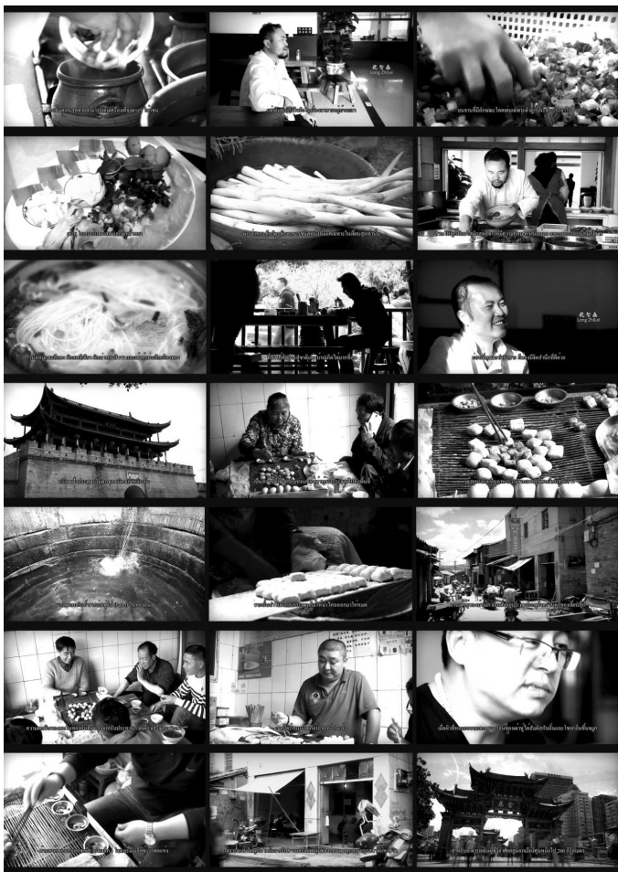
ภาพที่ 12 ผลงานสารคดีสั้นเรื่อง “รสชาติแห่งบ้านเกิด” 2