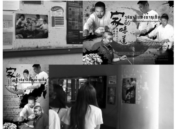
ภาพที่ 8 โปสเตอร์เชิญชวนเข้าร่วมรับชมสารคดีสั้นเรื่อง “รสชาติแห่งบ้านเกิด” (Lin Hongjun, 2016)

ทัศนคติที่ผู้วิจัยต้องการสื่อสารได้อย่างเหมาะสมมากที่สุด อันทำให้สามารถดึงดูดให้คนรุ่นหลัง นักท่องเที่ยวและเจ้าของธุรกิจที่เกี่ยวข้องได้ตระหนักถึงคุณค่า คุณประโยชน์ และความสำคัญของสัญลักษณ์ทางวัฒนธรรมที่มีอยู่ในอาหารว่างยูนนานให้ยังคงได้รับการสืบทอด เพื่อประชาสัมพันธ์ และส่งเสริมให้เกิดการอนุรักษ์สืบไป