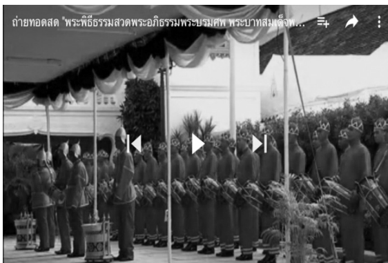
ภาพที่ 5 ภาพประโคมย้ายม

ล้วนแล้วแต่มีกลองมโหระทึกที่มีสองหน้าหรือมากกว่านั้น ซึ่งพิธีกรรมต่างๆ ภายในวัดนั้นยังมีการใช้กลองมโหระทึกมาจนถึงปัจจุบัน