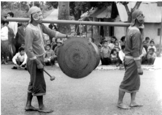
ภาพที่ 4 ภาพสงกรานต์ลาว

กลองมโหระทึกที่หล่อจากสำริดของกัมพูชาตามแบบเฮเกอร์ 1 เท่านั้นที่ปรากฏในประวัติศาสตร์ตอนต้นในระยสั้นๆ ของกัมพูชา และกลองก็ได้สูญหายไป ไม่สามารถพัฒนาไปเป็นกลองประเภทต่างๆ ได้ตั้งจีนและเวียดนาม (Sergey V.Lapteff, 2009:29) ในปัจจุบันกลองมโหระทึกหล่อจากสำริดแบบเฮเกอร์ 3 ทั้งหมดที่ถูกค้นพบนั้นไม่เพียงแต่มีจำนวนน้อยนิดเท่านั้น แต่ยังเป็นเพียงกลองที่มาจากยุคปลาย ล้วนแล้วแต่เป็นกลองที่มาจากยุคที่ใกล้เคียงกับราชอาณาจักรลาวและราชอาณาจักรไทยในปัจจุบัน ซึ่งล้วนแต่เป็นของขวัญที่ได้รับจากประเทศเพื่อนบ้าน (Yoshinori Yasuda, 2007:63-64) ประเทศกัมพูชาในปัจจุบันนี้ไม่มีการใช้กลองมโหระทึกแล้ว ถึงแม้ว่าในพระราชวังจะมีการจัดวางกลองดังกล่าวก็ตาม (กลองมโหระทึกหล่อจากสำริดแบบเฮเกอร์ 3) แต่งานพิธีกรรมต่างๆ ล้วนแล้วแต่ไม่ได้มีการนำกลองมโหระทึกมาใช้ เพียงแต่ให้กลองนั้นสัญลักษณ์ของพลังอำนาจในความทรงจำทางประวัติศาสตร์ และกลองมโหระทึกที่ถูกเก็บรักษาในพิพิธภัณฑ์ก็ไม่ต่างกัน