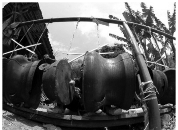
ภาพที่ 3 การใช้กลองของชาวโลโล

วัฒนธรรมกลองมโหระทึกที่มีที่มาจากจีนและภาคเหนือของเวียดนามนั้นได้รับผลกระทบในช่วงประวัติศาสตร์ตอนต้นของกัมพูชา แต่ต่อมาในช่วงพัฒนาการทางประวัติศาสตร์ก็ไม่สามารถทนต่อไปได้ เนื่องจากชาวพื้นเมืองส่วนใหญ่ของกัมพูชาคือชาวเขมรไม่เพียงแต่ไม่ยอมรับอิทธิพลทางวัฒนธรรมจีนที่อยู่ทางตอนเหนือ นอกจากนี้ยังได้รับผลกระทบด้านวัฒนธรรมจากอินเดียและคาบสมุทรมลายู หากก่อนการสถาปนาอาณาจักรพุนันผลกระทบนี้ไม่ได้มีการแสดงชัดเจนเท่าไรนั้น หลังจากสถาปนาอาณาจักรพุนัน วัฒนธรรมจากอินเดียและคาบสมุทรมลายูนั้นส่งผลกระทบอย่างมากต่อชาวเขมร ด้วยเหตุนี้จึงมีเพียง