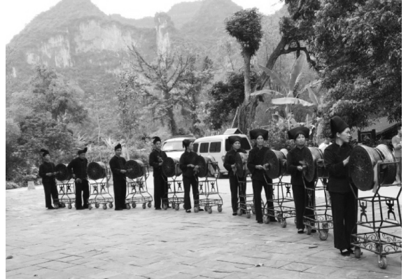
ภาพที่ 2 การใช้กลองของชนเผ่าจ้วง

ที่ประเทศเวียดนามมีหนังสือบันทึกว่ามีกลุ่มชนเผ่าส่วนน้อยเช่นมีชนเผ่าขมุ (Kho Mu) ชนเผ่าจายา (Giay) ชนเผ่าปู่แปว (Pu Peo) ชนเผ่าโคตู (Co Tu) ชนเผ่าโลโล (Lo Lo) ชนเผ่าเม็ง (Muong) ชนเผ่าปานาน (Bahnan) ชนเผ่า ม้ง (Hmong) ชนเผ่าไท