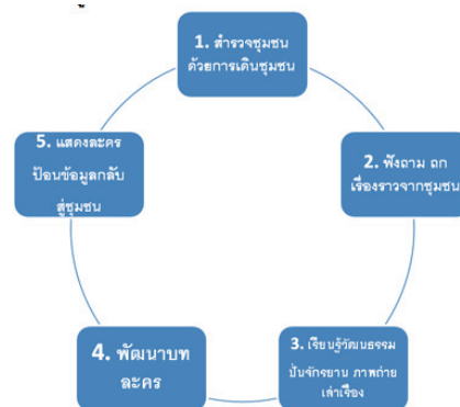
ภาพที่ 3 วงจรแสดงระยะการเก็บข้อมูลวิจัยด้วยกระบวนการศิลปะการละครเพื่อการเรียนรู้

ขั้นตอนนี้เป็นการเก็บข้อมูลด้วยกระบวนการศิลปะการละครเพื่อการเรียนรู้ ซึ่งแบ่งออกเป็น 5 ระยะ ซึ่งผู้วิจัยบูรณาการงานวิจัยกับการเรียนการสอนรายวิชาละครเพื่อการศึกษาและรายวิชาละครเพื่อการเรียนรู้ โดยออกแบบให้นิติตลงพื้นที่เก็บข้อมูล 5 ระยะ ดังนี้