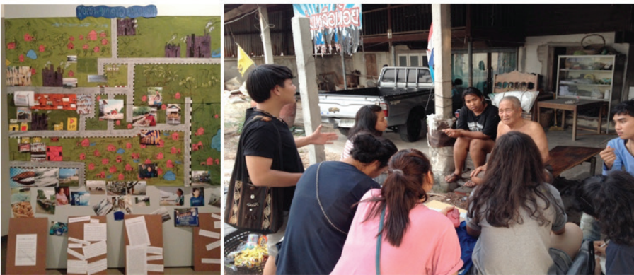
ภาพที่ 5 : ภาพแผนที่ชุมชนและบรรยากาศการฟังเรื่องเล่าชุมชน

ระยะที่ 2 การฟัง ถาม ถกเรื่องเล่าจากชุมชน เป็นกระบวนการทำความรู้จักชุมชนสำรวจสภาพทางภูมิศาสตร์เบื้องต้น สำรวจสถานที่สำคัญๆ รวมถึงสืบค้นเรื่องเล่าผ่านวิธีการชวนคุยล้อมวงเล่าเรื่อง ได้พูดคุยกับคนสำคัญในหมู่บ้าน เช่น กังแป้ว คนสำคัญของหาดวอนนภา เมื่อได้ข้อมูลพื้นฐานเรียบร้อยแล้ว ก็กลับมาพูดคุยและสรุปข้อมูลด้วยวิธีการทางศิลปะ เช่น การเล่าเรื่อง การวาดภาพ และการระบายสีอย่างง่าย เน้นที่การวิเคราะห์ข้อมูลชุมชนร่วมกัน จากนั้นทดลองสร้างเป็นแผนที่ชุมชนอย่างง่าย และนิทรรศการอย่างง่าย