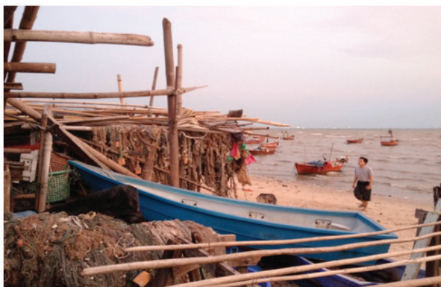
ภาพที่ 6 เครื่องมือทำประมงพื้นบ้านของคนในชุมชน