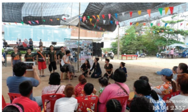
ภาพที่ 12 แสดงละครงานวันไหลหาดวอนนภา 15 เมษายน พ.ศ. 2557

กิจกรรมที่ใช้สำหรับเก็บรวบรวมข้อมูลทั้งหมดนี้ ผู้วิจัยขอใช้คำว่า “กระบวนการศิลปะการละครเพื่อการเรียนรู้ : เครื่องมือสำหรับการวิจัยชุมชน โดยผู้เก็บข้อมูลประกอบไปด้วยผู้วิจัยและผู้เรียนรายวิชาละครเพื่อการศึกษาและรายวิชาละครเพื่อการเรียนรู้” ซึ่งผู้วิจัยถือว่าผู้เรียนเหล่านี้เปรียบเสมือนผู้ช่วยนักวิจัยคนสำคัญ ที่ทำหน้าที่ทั้งเก็บรวบรวมข้อมูล วิเคราะห์ข้อมูล สังเคราะห์ข้อมูลผ่านกระบวนการต่างๆ และทำหน้าที่เป็นผู้ป้อนข้อมูลกลับคืนสู่ชุมชน ด้วยการแสดงละครเวทีและนิทรรศการภาพถ่ายเล่าเรื่อง หลักการสำคัญของกระบวนการศิลปะการละครเพื่อสร้างการเรียนรู้ คือ เน้นการมีส่วนร่วมของผู้ร่วมกิจกรรม มุ่งสร้างการมีส่วนร่วมของคนในชุมชน