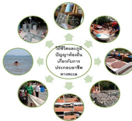
ภาพที่ 10 ภาพแสดงวิถีชีวิตและภูมิปัญญาท้องถิ่นของชาวบ้านหาดวอนนภา

ทั้งนี้ลักษณะเด่นของการบันทึกงานคือสามารถเข้าร่วมตัวเป็นกลุ่ม ไปพร้อมๆ กัน มีเวลาในการมอง สังเกตสองข้างถนน เป็นการสำรวจอย่างซ้ำๆ เมื่อสนใจอะไร หรือสิ่งใดสามารถหยุดพักหรือเข้าไปพูดคุยและเก็บข้อมูลได้ ขั้นตอนนี้เป็น การต่อยอดข้อมูลจากขั้นตอนการฟัง ถาม ถก นำข้อมูลพื้นฐานมาใช้เป็นตัวกำหนดเส้นทางและสถานที่สำคัญที่ต้องเก็บข้อมูลเพิ่มเติม วิธีการเก็บข้อมูลของผู้วิจัยและผู้เรียนคือการถ่ายภาพ ส่วนใหญ่เป็นการถ่ายภาพจากโทรศัพท์มือถือ โดยกำหนดโจทย์ให้บันทึกภาพที่แสดงวิถีชีวิต ภูมิปัญญาท้องถิ่นและสิ่งสำคัญในหาดวอน เมื่อได้รูปภาพมาแล้ว จะนำกลับมาเล่าเรื่องให้กลุ่มฟังและนำกลับมาทำภาพถ่ายเล่าเรื่องชีวิตหาดวอน