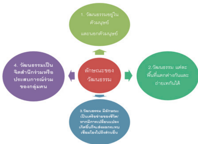
ภาพที่ 2 : ภาพแสดงลักษณะเฉพาะของวัฒนธรรม

จากการทบทวนวรรณกรรมเกี่ยวกับนิยามคำว่า “วัฒนธรรม” พบกลุ่มคำที่เกี่ยวข้องสัมพันธ์กัน เช่น ความเชื่อ คุณค่า และการประพฤติปฏิบัติของกลุ่มคน เป็นต้น ทำให้พบลักษณะของวัฒนธรรม ว่ามีลักษณะดังแผนภาพที่ 2