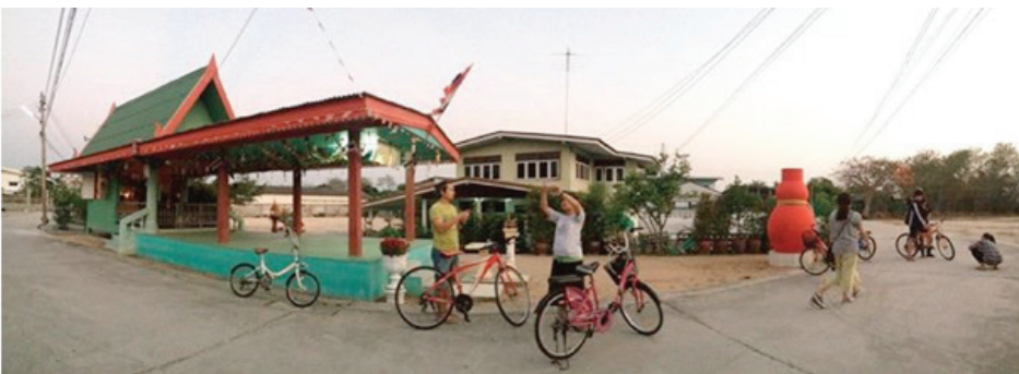
ภาพที่ 7 : กิจกรรมการปั่นจักรยานเรียนรู้ชุมชน (ทิมพิกา นันทะสร, เมษายน 2557)

ระยะที่ 3 เรียนรู้วัฒนธรรมผ่านการปั่นจักรยานและกิจกรรมถ่ายภาพเล่าเรื่อง ขั้นตอนนี้เป็นกรเก็บข้อมูลเพิ่มเติม โดยใช้ข้อมูลเบื้องต้นจากการฟัง ถาม ถก มากำหนดเส้นทางและสถานที่สำคัญ เก็บข้อมูลด้วยกิจกรรมการปั่นจักรยานและกิจกรรมถ่ายภาพเล่าเรื่องโดยกำหนดโจทย์ให้บันทึกภาพวิถีชีวิตและสิ่งสำคัญของหาดวอนนภาที่แต่ละคนสนใจ เมื่อได้รูปภาพมาแล้ว นำกลับมาเล่าเรื่องให้กลุ่มฟังและนำกลับมาทำกิจกรรมภาพถ่ายเล่าเรื่องชีวิตหาดวอน