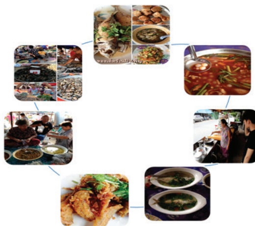
ภาพที่ 13 เมนูเด็ดหาดวอนจากร้านอาหารพื้นบ้านและตลาดนัดหาดวอน

อาหารทะเลพื้นบ้านกับร้านอาหารหาดวอน อาหารทะเลหาดวอนส่วนใหญ่นำวัตถุดิบทางทะเลจากท้องถิ่น ซึ่งการทำอาหารมีภูมิรู้จากท้องถิ่นโดยคนท้องถิ่น ปรากฏเป็นธุรกิจร้านอาหารจำนวนมาก ร้านอาหารมีทั้งร้านเก่าแก่เป็นที่นิยมของนักท่องเที่ยว เช่น ร้านป่าเพ็ญ ร้านโรจน์ซีฟู้ด คริวปลาทุ ร้านน้ำติ ส่วนร้านอาหารราคาย่อมเยาเหมาะกับนิสิตนักศึกษาและคนในชุมชน เช่น ร้านป่าเล็ก คริวไกลลิบ และร้านเจ๊ณี แต่ละร้านอาหารมีเมนูอร่อยสูตรเฉพาะของร้าน เช่น ปลาทุตัมส้ม ปลาหมึกต้มน้ำดำ ปลาเห็ดโคนทอดน้ำปลา แกงป่าปลาเห็ดโคน หอยตลับผัดน้ำพริกเผา ปลากระพงราดพริก เป็นต้น