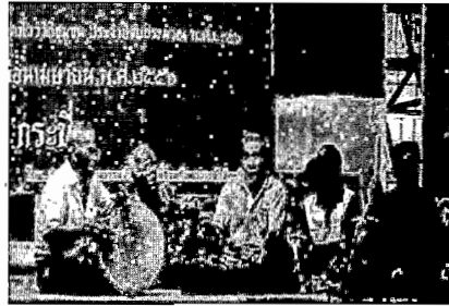
ภาพที่ 3 วงดนตรีลิเกป่า

จากการศึกษาพบว่า การแสดงลิเกป่าคณะรวมมิตรบันเทิงศิลป์ในด้านของการแต่งกาย ส่วนใหญ่ยังคงยึดรูปแบบการแต่งกายแบบดั้งเดิม ส่วนการแต่งกายแบบสมัยใหม่อาจมีบ้างในบางครั้ง ทั้งนี้ขึ้นอยู่กับสถานการณ์และโอกาสในการแสดง