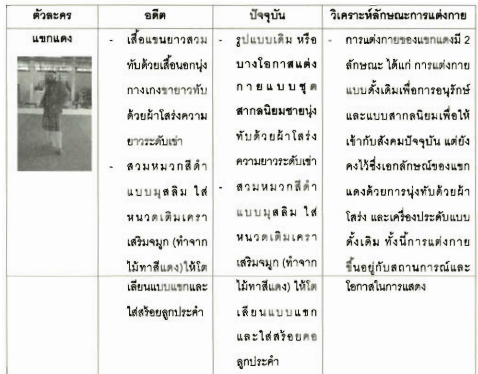
ตารางที่ 1 สรุปลักษณะการแต่งกายของตัวละครชุดแขกแดง

จากการศึกษาในส่วนของสถานที่สำหรับแสดงพบว่า ลิเกป่าได้มีการปรับตัวในส่วนของสถานที่ให้เข้ากับสถานการณ์ปัจจุบันเพื่อความสะดวกในการชมของผู้ชม และการจัดสถานที่ของเจ้าของงาน