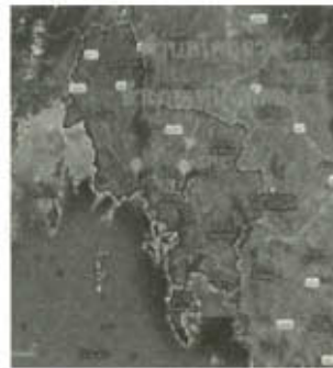
ภาพที่ 1 แผนที่แสดงพื้นที่ทำการศึกษา

ในการศึกษาครั้งนี้ ผู้วิจัยเลือกศึกษาเฉพาะลิกเปาคนะรวมมิตรบันเทิงศิลป์ ตำบลโคกยาง อำเภอเหนือคลอง จังหวัดกระบี่