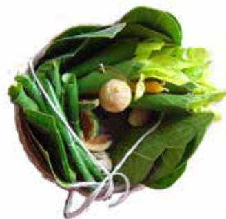
ภาพที่ 1 การสาธิตขั้นตอนการทำอุปกรณ์ประกอบพิธีจวมกันเน็ด และตัวจวมกันเน็ด ซึ่ง “มีลักษณะเหมือนห่านน้ำ”

อุปกรณ์ที่ใช้ประกอบพิธีจวมกันเน็ด ได้แก่ กะลามะพร้าว ชี่ไถ้ เทียน 2 เล่ม ไบกล้วยทำกรวย 5 กรวย ไบขนุน เชือก เหรียญเงิน 1 บาท หมาก (ไพล) ความหมายของอุปกรณ์แต่ละชนิด มีรายละเอียด ดังนี้