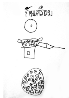
ภาพที่ 3 ผลงานของเด็กที่แสดงถึงความเข้าใจเกี่ยวกับตนเองและวัฒนธรรมของตนด้านภาษา

ความเข้าใจเกี่ยวกับตนเองและวัฒนธรรมชุมชนของตนด้านเชื้อสาย เด็กสะท้อนให้เห็นการรับรู้ลักษณะเชื้อสายของตน โดยสังเกตได้จากการแต่งกาย อาหารพื้นบ้าน ขนมพื้นบ้านประเพณีในชุมชนของตน ซึ่งแตกต่างจากชุมชนอื่น