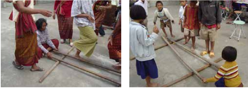
ภาพที่ 4 ความเข้าใจเกี่ยวกับตนเองและวัฒนธรรมชุมชนของตนด้านเชื้อสาย: การรำฟั้นบ้าน (รำสาก)

ความเข้าใจเกี่ยวกับตนเองและวัฒนธรรมชุมชนของตนด้านการดำรงชีพ เด็กสะท้อนให้เห็นการรับรู้ลักษณะของอาชีพต่าง ๆ ในชุมชน โดยสังเกตได้จากกิจกรรม เครื่องมือเครื่องใช้ สถานที่และเวลาในการประกอบอาชีพ เด็กสามารถปฏิบัติตน และแสดงบทบาทสมมติสะท้อนให้เห็นการรับรู้ว่าคุณค่าที่ดำรงชีวิตด้วยอาชีพต่าง ๆ กันในชุมชน ต้องช่วยเหลือและพึ่งพาอาศัยกัน นอกจากนี้ คนในชุมชนต้องดูแลรักษาทรัพยากรที่ใช้หมุนเวียนในการดำรงชีวิต ทุกคนจึงมีหน้าที่ต้องปกป้อง ดูแลทรัพยากรธรรมชาติในชุมชนของตน และควรปฏิบัติเช่นเดียวกันในสังคมโลก เพื่อการดำรงชีวิตอย่างไม่เบียดเบียนชีวิตอื่นที่มีคุณค่าเช่นเดียวกับชีวิตของเรา