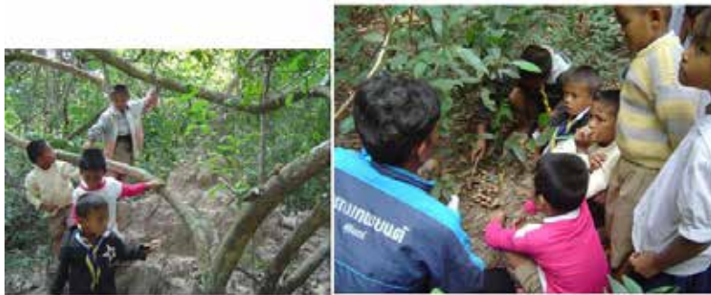
ภาพที่ 5 ความเข้าใจเกี่ยวกับตนเองและวัฒนธรรมชุมชนของตนด้านการดำรงชีพ: สืบหาสิ่งมีชีวิตในป่า

ความเข้าใจเกี่ยวกับตนเองและวัฒนธรรมชุมชนของตนด้านการดำรงชีพ เด็กสะท้อนให้เห็นการรับรู้ลักษณะของอาชีพต่าง ๆ ในชุมชน โดยสังเกตได้จากกิจกรรม เครื่องมือเครื่องใช้ สถานที่และเวลาในการประกอบอาชีพ เด็กสามารถปฏิบัติตน และแสดงบทบาทสมมติสะท้อนให้เห็นการรับรู้ว่าคุณค่าที่ดำรงชีวิตด้วยอาชีพต่าง ๆ กันในชุมชน ต้องช่วยเหลือและพึ่งพาอาศัยกัน นอกจากนี้ คนในชุมชนต้องดูแลรักษาทรัพยากรที่ใช้หมุนเวียนในการดำรงชีวิต ทุกคนจึงมีหน้าที่ต้องปกป้อง ดูแลทรัพยากรธรรมชาติในชุมชนของตน และควรปฏิบัติเช่นเดียวกันในสังคมโลก เพื่อการดำรงชีวิตอย่างไม่เบียดเบียนชีวิตอื่นที่มีคุณค่าเช่นเดียวกับชีวิตของเรา