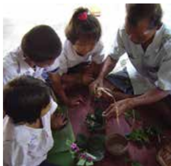
ภาพที่ 2 ภาพชายครูตาสมกำลังสอนให้เด็กจัดจวมกันเนียด และ ภาพขวาเป็นผลงานของเด็กๆ